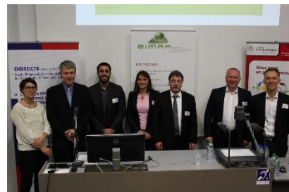
Intervenants et organisateurs

Le GIMRA a offert le cocktail en fin de soirée.